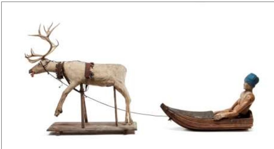
Det s.k. ekipaget – renen, ackjan och dockan med de samiska föremålen - vid Livrustkammaren.