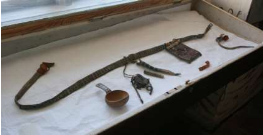
De samiska föremålen på Skokloster slott förvaras i en monter i ett rum som inte visas vid de ordinarie visningarna.