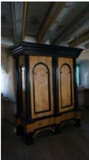
I ett kuriosakabinett förvaras några av de samiska föremålen på Skokloster slott.