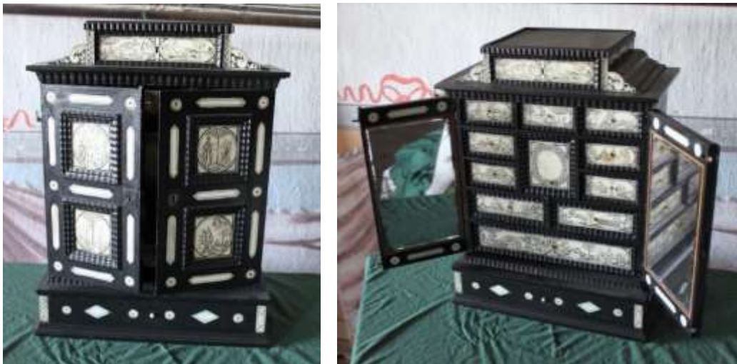
Kabinettskåp inv-nr 3160 på Skokloster slott.

Ytterligare ett äldre föremål med anknytning till den samiska kulturen och med datering slutet av 1600-talet eller början av 1700-talet finns på Skokloster slott. Det är ett s.k. kabinettskåp. Kabinettskåpen har lådor med fronter av benplattor med ingraverade bilder ur Johannes Schefferus verk Lapponia, som utkom 1673. Det har inv.nr 3160. Skåpet har två dörrar med elva större och mindre draglådor.