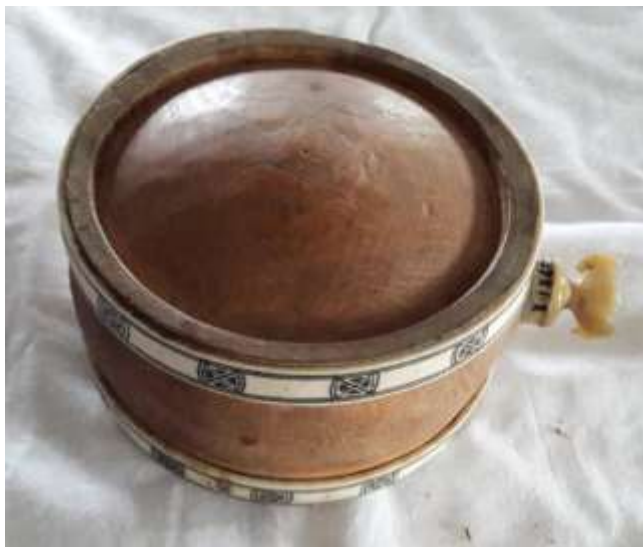
Kagge av trä med graverade hornband.